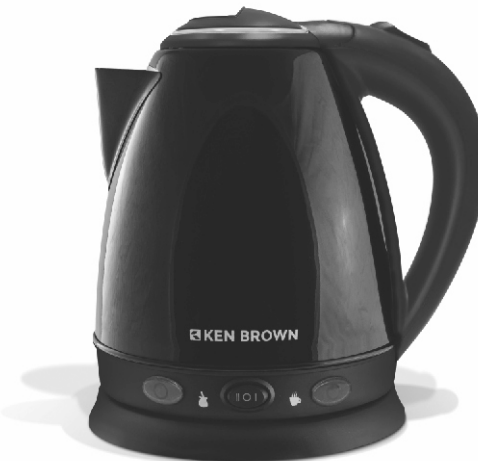
IMAGEN A MODO ILUSTRATIVO