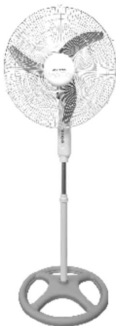
IMAGEN A MODO ILUSTRATIVO