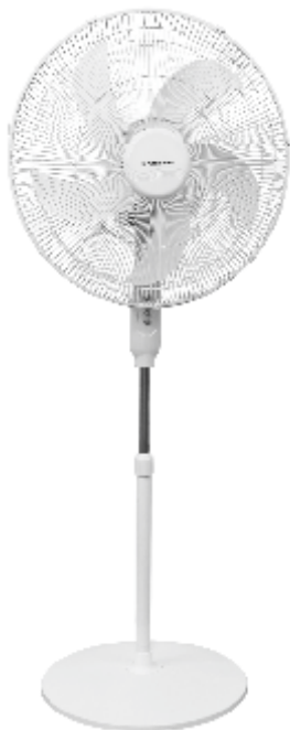
IMAGEN A MODO ILUSTRATIVO